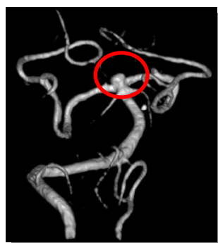
頭部 MRA-VR (動脈瘤)