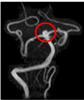
頭部 MRA-MIP (動脈瘤)