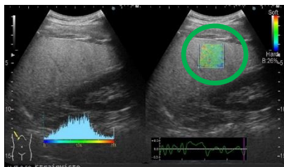
肝臓の弾性をカラー化している場面

肝炎ウイルスやアルコール、脂肪蓄積などが原因で肝臓に慢性的な炎症が生じ、肝細胞が破壊され、そこに線維組織が広がり肝臓が固くなってしまった状態を肝硬変といいます。エコーでの肝硬変を疑う所見は特徴的ではあるものの、従来の方だと見た目中心の評価のため客観性に乏しい部分もありました。しかしながら、近年超音波装置や学術的研究の進歩により肝臓の線維化を数値で評価できるようになってきました。